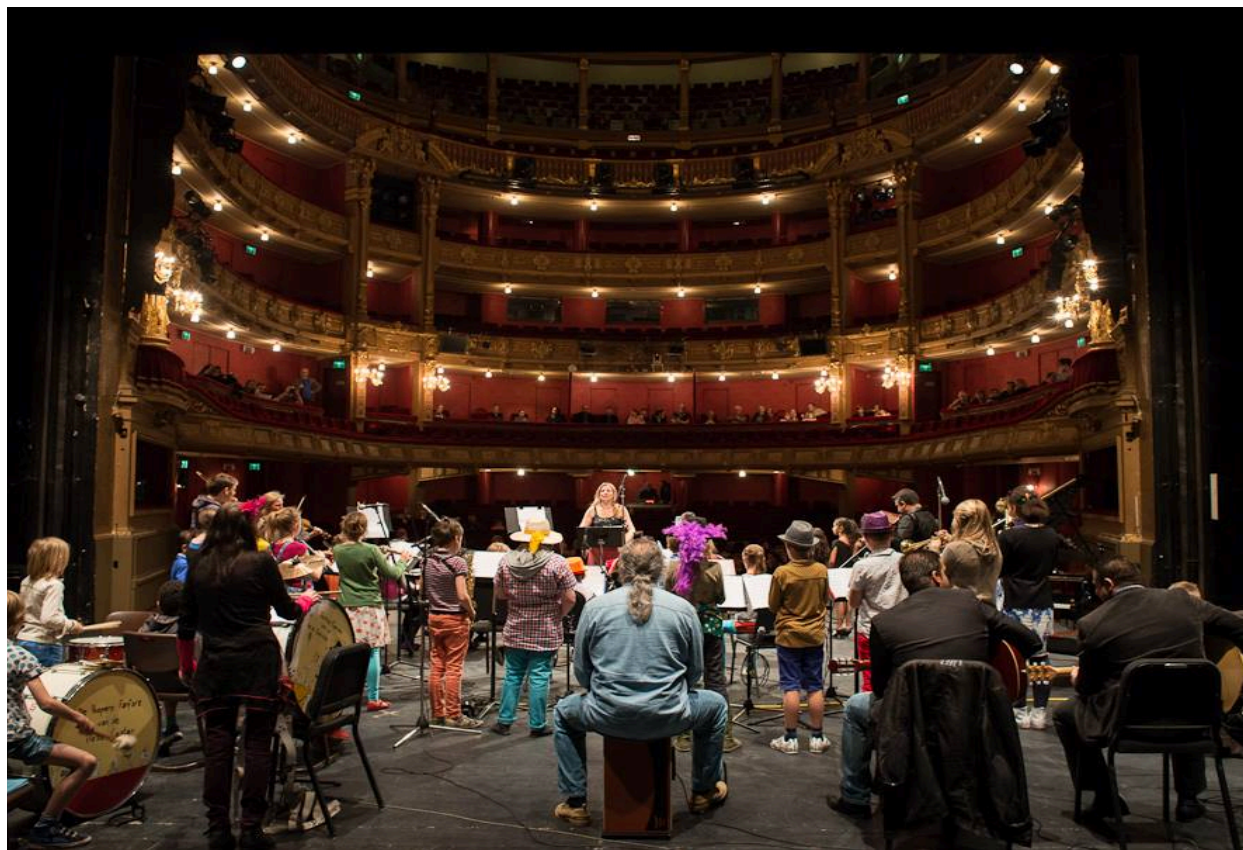
Dag van de Muziekeducatie 3/5/2014 Goeste Majeur & Opre Roma