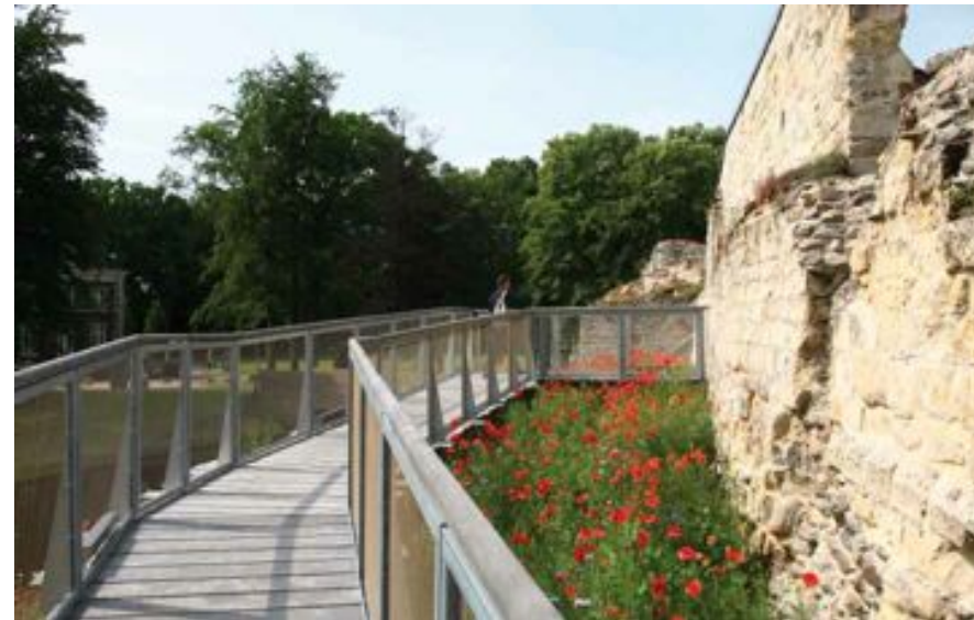
FIG. 2 Waterburcht Pietersheim in Lanaken

Deze brochure gaat ervan uit dat elke gebruiker zoveel mogelijk zelfstandig en samen met anderen zo goed mogelijk moet kunnen genieten van ons permanent opengesteld onroerend erfgoed. Iedere gebruiker en bezoeker zou op haar/zijn manier aan activiteiten die er plaatsvinden, moeten kunnen deelnemen, maar steeds rekening houdend met de 'draagkracht' en het behoud van de intrinsieke waarden van het betrokken erfgoed.