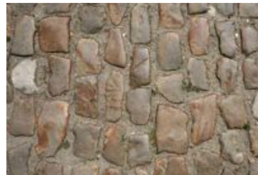
FIG. 14 Begijnhof van Diest Deze vossenkopjes zijn decennia lang stevig in rijen blijven liggen met niet te brede, goed gevulde voegen in en tussen de rijen. Daardoor liggen zij nog steeds goed vlak en zijn ze behoorlijk goed betreedbaar en berijdbaar voor mensen die moeilijk te been zijn of zich in een rolstoel verplaatsen.