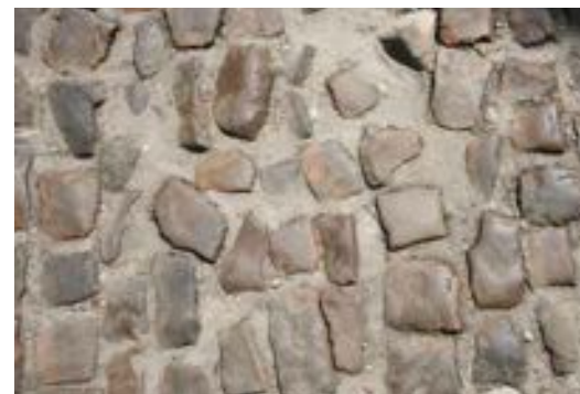
FIG. 15 Begijnhof van Diest Straatstenen worden na wegenwerken dikwijls onoordeelkundig en slordig herplaatst zonder de rijen en voegbreedte te respecteren. De vossenkopjes worden zo moeilijk betreedbaar en los gewrikt door wagens en te zwaar verkeer, waardoor ze gaan wankelen en worden uitgereden.