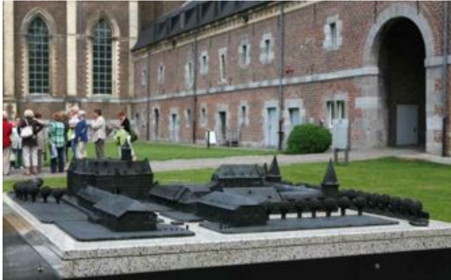
FIG. 23 Landcommanderij Alden Biesen Volumemaquettes zijn een welkom hulpmiddel om slechtziende en blinde mensen een ruimtelijk beeld te laten vormen van een object of een site.