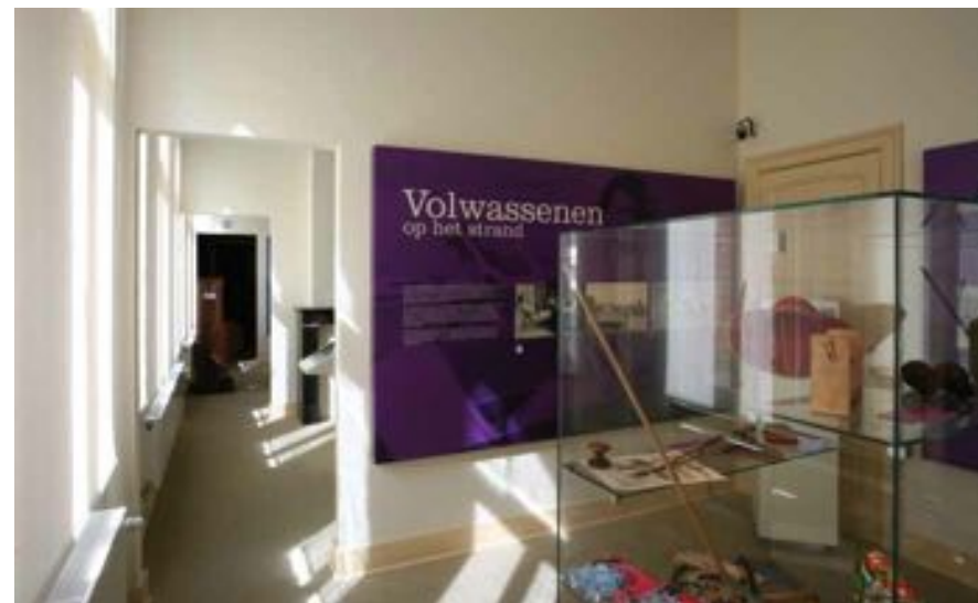
FIG. 7 Museum Kusthistories in Middelkerke Het Museum Kusthistories is gevestigd in het beschermde voormalige Postgebouw van Middelkerke. De nieuwe muuropeningen bevorderen de circulatiemogelijkheden en daardoor de ontsluiting en de toegankelijkheid voor alle gebruikers.

Het is bij vergunningsplichtige werken aan publiek toegankelijke onroerend erfgoed ten zeerste aangewezen om het agentschap Ruimte en Erfgoed vanaf het begin bij het dossier van vergunningsplichtige werken aan beschermd erfgoed te betrekken. Het agentschap moet immers conform artikel 35 van het Besluit van de Vlaamse Regering van 5 juni 2009 tot vaststelling van een gewestelijke stedenbouwkundige verordening betreffende toegankelijkheid, in zijn adviezen de afweging maken betreffende de vereisten van toegankelijkheid en het behoud van de erfgoedwaarden.