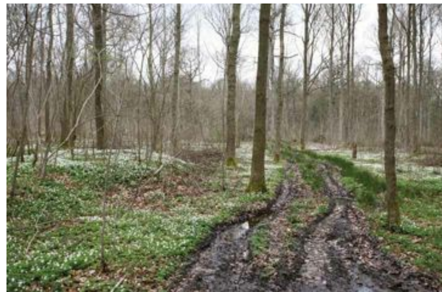
FIG. 6 Betere toegankelijkheid van beschermde landschappen is niet voor de hand liggend.

Een beschermde landschap is een landschap dat volgens dit decreet definitief beschermd is.