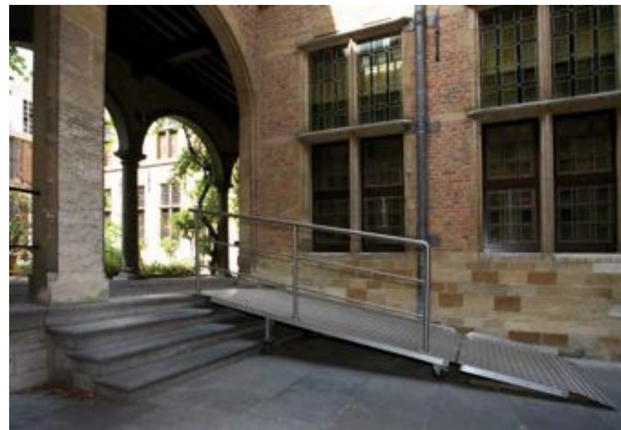
FIG. 18 Museum Rockoxhuis in Antwerpen

Toch kan het om kunsthistorische redenen aangewezen zijn om bijgevels met hoge architecturale waarde - waar imposante trappenpartijen en plinten onverbreekbaar deel uitmaken van het architecturale concept - wegneembare hellingbanen