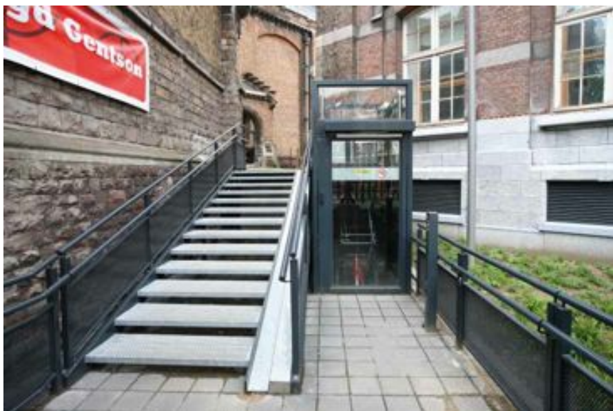
FIG. 20 Leopoldkazerne in Gent

In de kazerne heeft plaatsgebrek voor een hellingbaan geleid tot de constructie van een platformlift die het aanzienlijk hoogteverschil tussen de twee niveaus overbrugt.