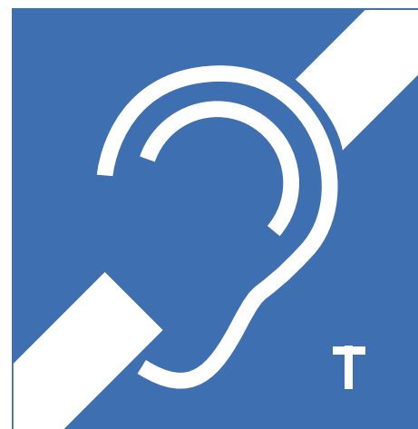
FIG. 25 Ringleidingen Ringleidingen zorgen ervoor dat mensen met een hoorapparaat met draadspoel via instelling op de T-stand, draadloos het geluid van bijvoorbeeld een kerk, een concert-, conferentie- of vergaderzaal zuiver kunnen beluisteren zonder versterking van de storende bijgeluiden.