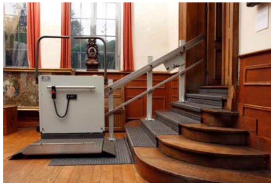
FIG. 21 Parkabdij in Heverlee

Platformliften gaan recht omhoog tot ca. 150 cm en staan al dan niet in een afgesloten koker. Zij kunnen zowel binnen als buiten geplaatst worden. Platformliften zijn enkel geschikt voor rolstoelgebruikers. Het platform telt extra voorzieningen voor de beveiliging van de rolstoelgebruiker. Platformliften worden eveneens door de gebruiker zelf gestuurd. Platformliften kunnen op een niet-destructieve, omkeerbare wijze geplaatst worden. Er bestaan ook eenvoudig verplaatsbare platformliften. Platformliften zijn er in elektrische en hydraulische uitvoeringen. De voorkeur gaat naar elektrische platformliften want lekkende hydraulische olie kan ongemerkt onherstelbare vlekken op vloeren van historische interieurs nalaten.