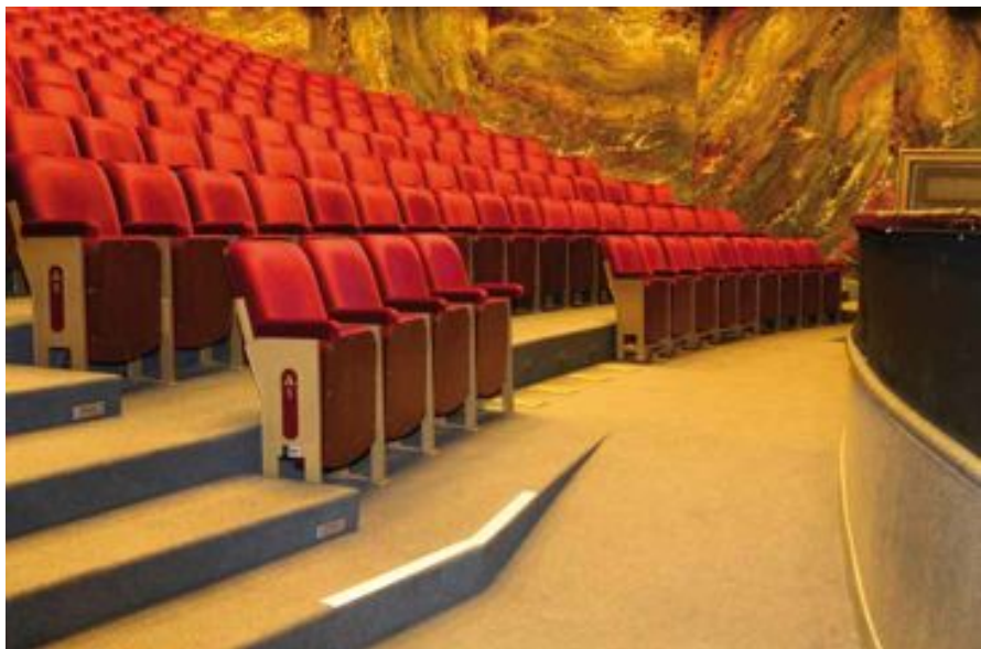
FIG. 12 Kunstencentrum Vooruit in Gent

De Theaterzaal is op twee niveaus toegankelijk gemaakt voor rolstoelgebruikers. De toegankelijkheid is verzekerd door een discrete hellingbaan en negen tijdelijk wegneembare zetels.