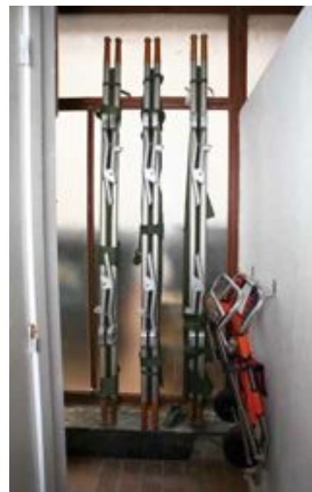
FIG. 26 Kunstencentrum Vooruit in Gent

Uit onderzoek blijkt dat juist oudere slechthorenden meer moeite hebben met het gebruik van ondertiteling omdat zij minder informatie tegelijk kunnen verwerken. Automatische spraakherkenning staat nog in de kinderschoenen, maar er zit toekomst in. Naar mate automatische spraakherkenners sneller en nauwkeuriger werken en de gebruikers meer vertrouwd met het systeem zullen zijn, zal het comfort toenemen.