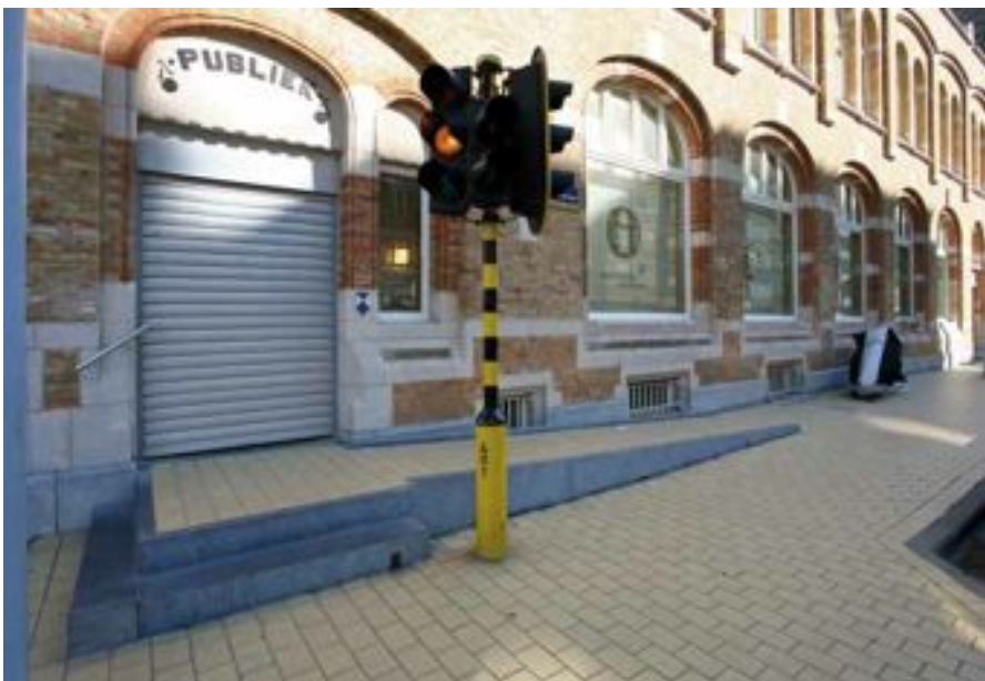
FIG. 17 Museum Kusthistories in Middelkerke

Vaste hellingbanen zijn vanuit stabiliteitsredenen meer geschikt om grote hoogteverschillen op te vangen. Ze laten zich in de regel qua materiaal en afwerking ook goed integreren in onroerend erfgoed. Vaste hellingbanen moeten met dezelfde zorg behandeld worden als het onroerend erfgoed.