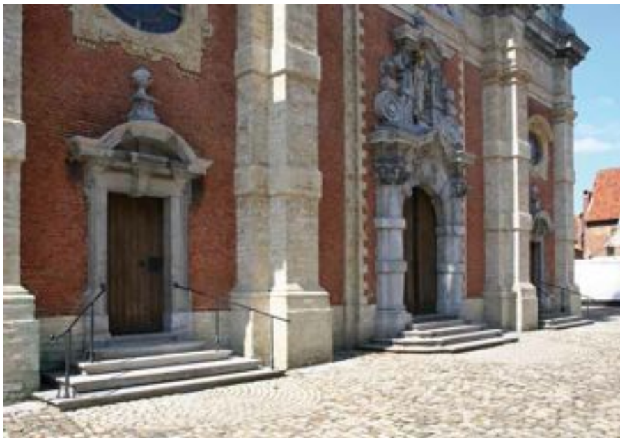
FIG. 22 Begijnhof van Lier

Trapleuningen helpen mensen die slecht te been zijn autonoom trappen te bestijgen en af te dalen. Daarom moeten er steeds leuningen aan beide kanten van de trap geplaatst worden. Deze plaatsing laat toe dat ook linkshandige mensen de trapleuningen kunnen gebruiken. De historisch smeedijzeren trapleuningen aan de begijnhofkerk beantwoorden niet helemaal aan de eisen van een integrale toegankelijkheid, maar ze zijn wel heel bruikbaar.