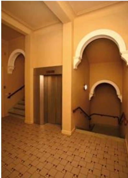
FIG. 19 Kunstencentrum Vooruit in Gent De kooilift is ingebouwd in de centrale traphal en bedient tot en met de derde verdieping.

Wegneembare hellingbanen lenen zich uitstekend voor het overbruggen van kleine hoogteverschillen waar vaste hellingbanen om erfgoedredenen niet aangewezen zijn.