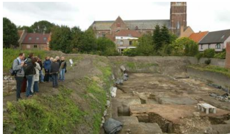
FIG. 4 Noodopgraving in Oudenburg

Om de leesbaarheid van de handleiding te bevorderen zijn tekst en ondertekeningen in een groter lettertype dan de voorgaande handleidingen afgedrukt. Op de website van het VIOE kan de handleiding in pdf naar behoeven verder uitvergroot worden.