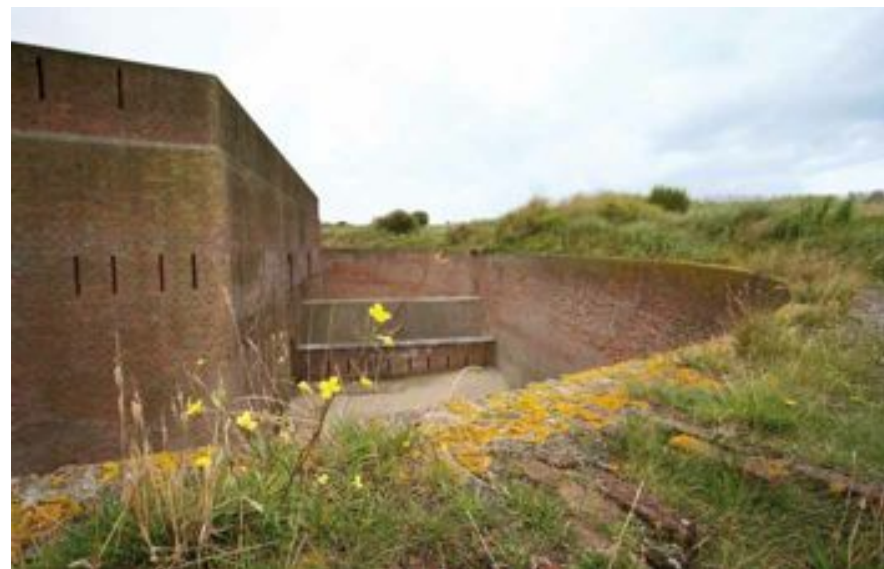
FIG. 27 Fort Napoleon in Oostende

Ook de trajecten van het gemeenschappelijke en toegankelijke vervoer kunnen aangekondigd worden op de website van Toegankelijk Vlaanderen.