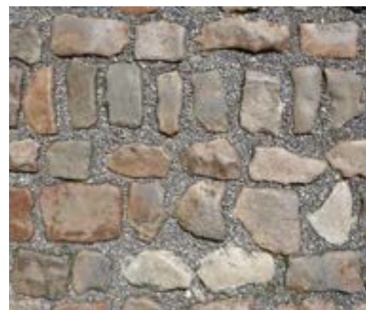
FIG. 16 Begijnhof van Diest Straatstenen die in fijn porfiergrind geplaatst worden, liggen vaster dan in straatzand. Toch moeten de voegen in en tussen rijen met kasseien in het algemeen en met kleine gepolijste vossenkopjes in het bijzonder smal zijn omdat de stenen dan stabiel liggen, niet de indruk geven in de porfiergrint te zwemmen en vooral minder hobbelig zijn, hetgeen de betreedbaarheid ten goede komt.