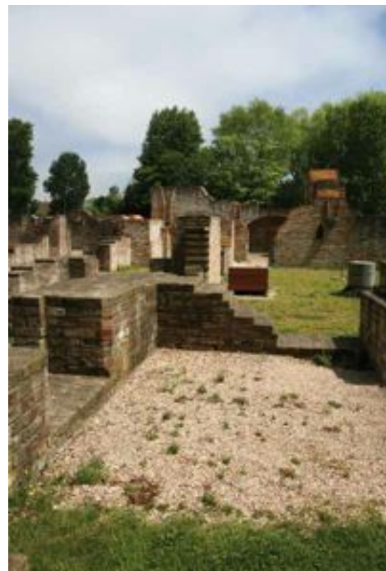
FIG. 10 Abdij Ten Duinen in Koksijde

Toegankelijkheid van bovengrondse, permanent opengestelde archeologische sites zoals de abdij Ten Duinen in Koksijde of de burchtrüine van Lanaken is te vergelijken met deze van permanent opengestelde gebouwen met erfgoedwaarde of beschermde parken en tuinen.