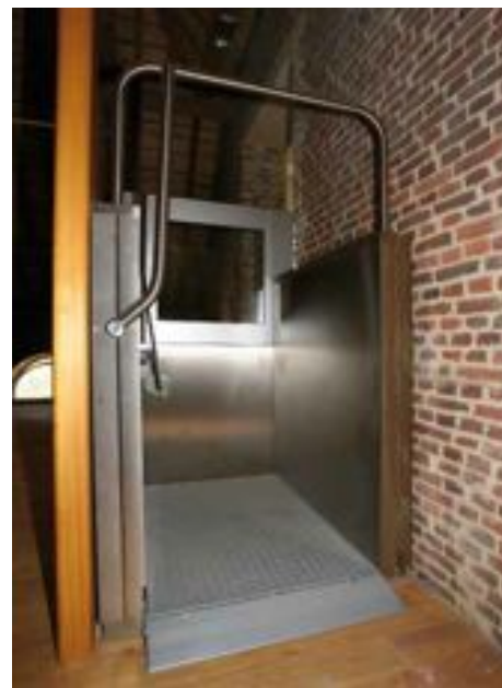
FIG. 8 Abdij Herkenrode De zolders van het hoevecomplex van de abdij zijn door middel van kooiliften ontsloten en toegankelijk gemaakt. Om de vloerniveaus van de zolders via het hoger vloerniveau van de centraalbouw met elkaar te verbinden moesten bijkomende trappen voorzien worden. Om de zolders ook voor rolstoelgebruikers met elkaar te verbinden, heeft de restauratie-architect platformliften voorzien. De platformliften en trappen zitten verscholen achter een gesloten houten wand die meteen ook dienst doet als borstwering voor het trapbordes.