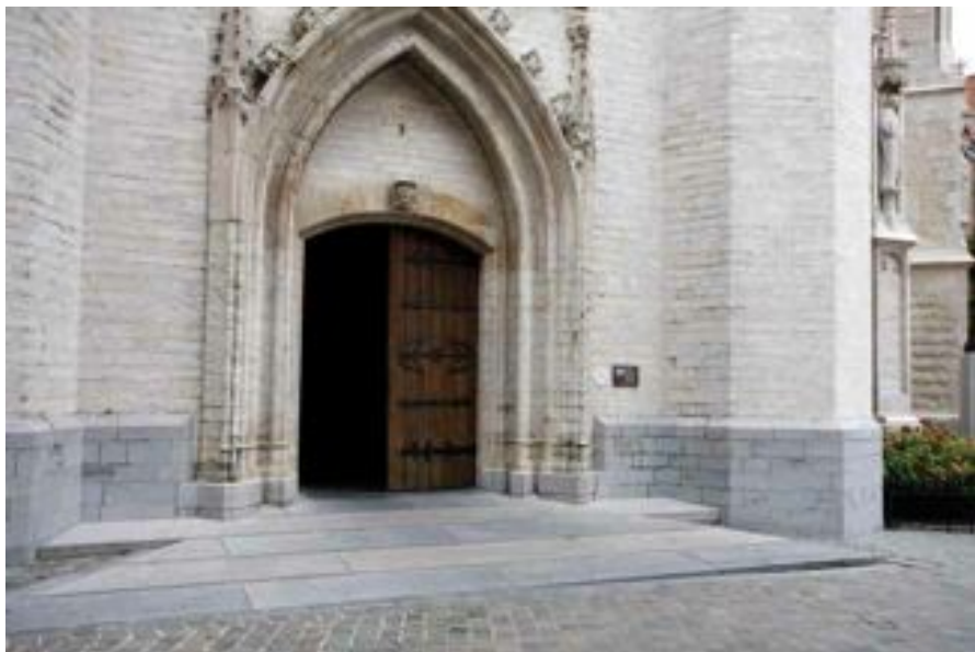
FIG. 5 Sint-Martinusbasiliek in Halle

Eenvoudige voorzieningen die inspelen op nieuwe noden betreffende toegankelijkheid - zoals trapleuningen - hoeven niet noodzakelijk in hedendaagse industrieel vervaardigde materialen zoals roestvrij staal, aluminium, glas of