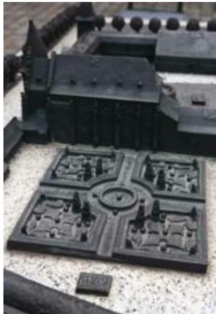
FIG. 24 Landcommanderij Alden Biesen Brailleschrift geeft uitleg over de onderdelen van de volumemaquette van de site. Braille is voor blindgeborenen het geschreven communicatiemiddel bij uitstek, maar de grote groep van laatblinden en slechtzienden zijn er niet mee gebaat omdat zij het op latere leeftijd niet meer aanleren. Interactieve audio-ondersteuning, waarbij het betaste object becommentarieerd wordt, biedt hier een oplossing. Dat is de idee achter de erfgoedconsole (hoofdstuk 7).

De groep van bezoekers en gebruikers die blind zijn bestaat uit personen die, na de beste optische correctie met bril of lenzen, een gezichtsscherpte hebben van minder dan 1/10 met beide ogen. Dat wil zeggen dat deze mensen slechts op 1 meter afstand waarnemen wat anderen op 10 meter zien. Blind is men ook wanneer het gezichtsveld ten hoogste 20 graden bedraagt. Bij goed ziende personen is het gezichtsveld ongeveer 180 graden.